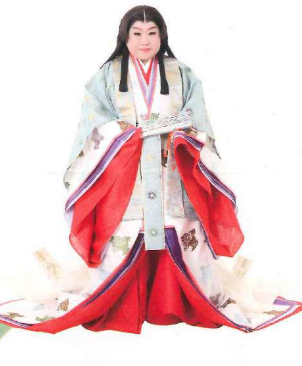
天童よしみ TENDO YOSHIMI