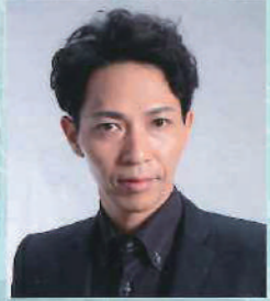
RON×II RON RON