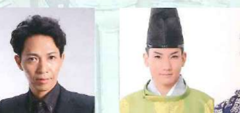
RON×II RON RON