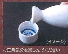
お正月気分を楽しんでください