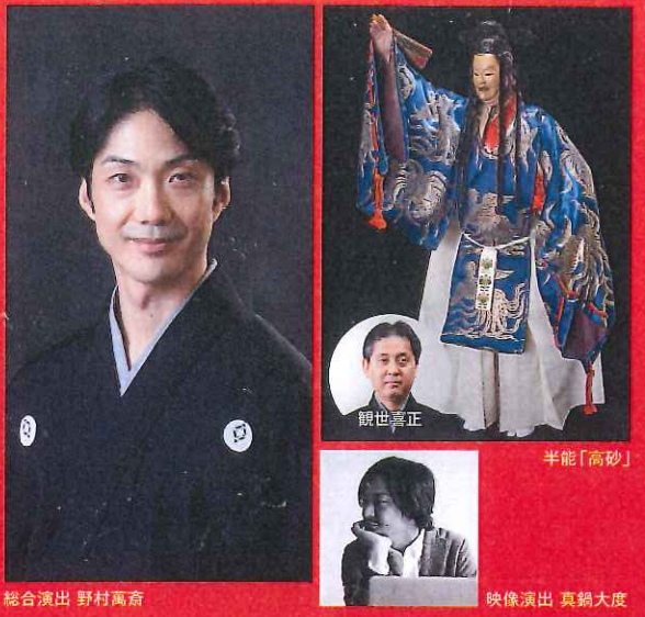
総合演出 野村萬斎 映像演出 真鍋大度