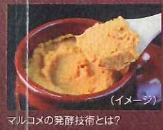
マルコメの発酵技術とは?