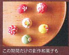
この期間だけの創作和菓子もお目見えします