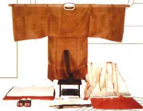
明治天皇御束帯（黄檗染御袍）一式

この展覧会では、小原家文庫（皇學館大学佐川記念神道博物館）をはじめ、大切に伝えられてきた大札（即位礼・大嘗祭）に関する資料を、多くの皆様にご覧頂けたら幸いです。