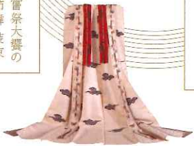
大嘗祭大嘗の五節舞装束